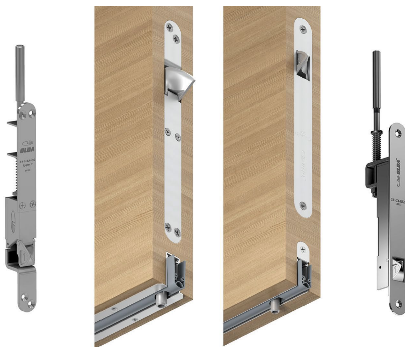
Bild 5: Olda kantreglar går utmärkt att integrera med automatiska tätningströsklar från Athmer med dess integrerade styrbleck för Ø 8 mm reglar. Till vänster i bilden visas OLDA 34 HZA-DS integrerat med Schall-Ex L-15/30 OS, till höger OLDA 33 HZA-R32F 8x60 integrerat med Schall-Ex L-15/30 WS.