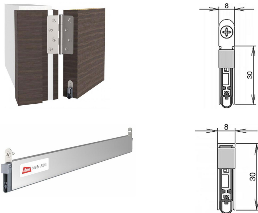
Bild 3: Den nytvecklade Schall-Ex® L-8/30 WS automatiska tätningströskel behöver endast en urfräsning på 8 x 30 mm, vilket gör den till Athmers smalaste tätningströskel med självsläckande silikontätningstlist för skydd mot ljud, rök och eld.