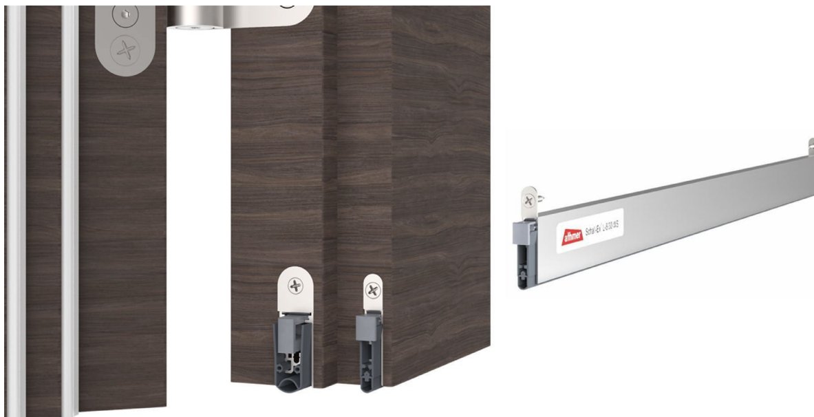
Bild 1: Nya Schall-Ex® L-8/30 WS automatiska tätningströskel är speciellt lämpad för parallell montering i dubbelfalsade dörrblad. Den erbjuder 49 dB ljudreduceringsnivå vid 7 mm golvspringa, helt vertikal rörelse för maximal täthet och verktygsfri justering. (Bilden visar parallellmontering med Schall-Ex® L-15/30 WS)