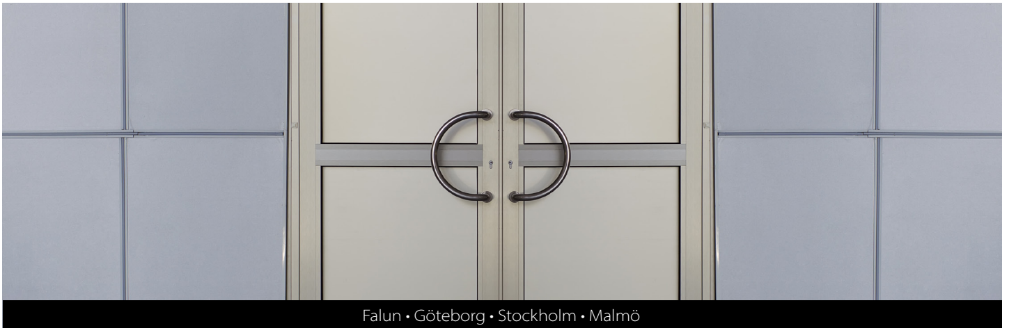
Falun • Göteborg • Stockholm • Malmö

INFORMATION OCH NYHETER FRÅN GÖTHES KONCERNEN • NR 1 2020 • ÅRGÅNG 19